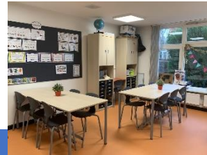
Schakelgroep Extra taalaanbod voor anderstalige leerlingen uit Arcen - Lomm - Velden